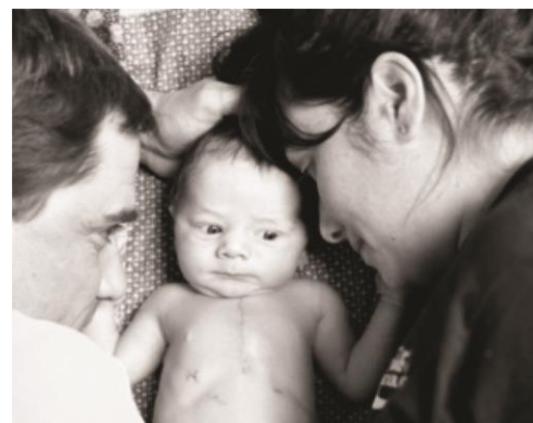
Acurrucarse con mamá y papá

Recuerde que no existe una manera correcta de sobrellevar la enfermedad. La experiencia de cada padre es única. Más abajo se detallan las estrategias que le recomendamos y que pueden ayudarle en los momentos de estrés.